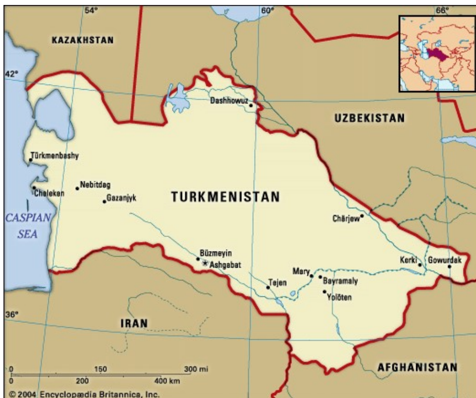
اطلاعات اساسی ترکمنستان

مساحت: 491210 کیلومترمربع (پنجاه و دومین کشور دنیا و دارای مساحتی حدوداً یک سوم مساحت ایران)