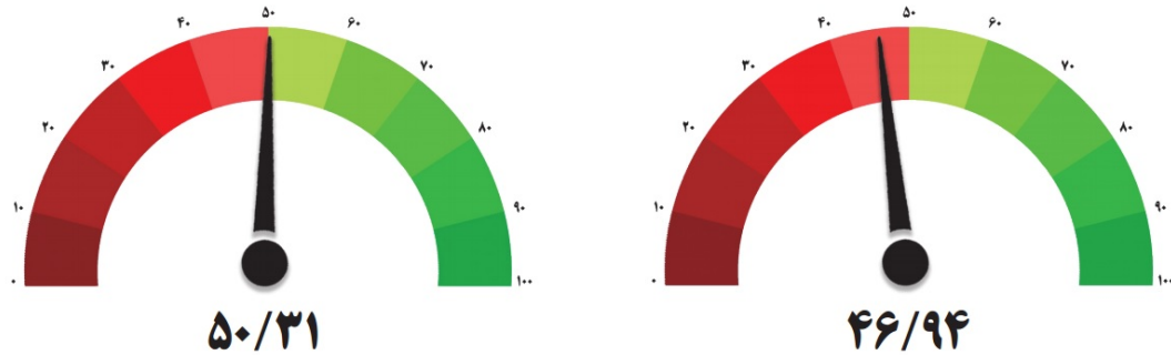
شامخ صنعت - دوره چهارم

مرکز پژوهش‌های اتاق ایران در گزارش دوره بیست و هشتم طرح شاخص مدیران خرید (PMI) کل اقتصاد موسوم به شامخ، اعلام کرده است که رقم این شاخص در دی ماه ۱۴۰۰ به ۴۶,۹۴ واحد رسیده که کمترین نرخ در ۵ ماه اخیر است. در این ماه به جز شاخص سرعت انجام و تحویل سفارش، سایر مؤلفه‌های اصلی زیر ۵۰ واحد ثبت شده‌اند. همچنین این مرکز در گزارش چهلمین دوره طرح شاخص مدیران خرید (PMI) بخش صنعت، شامخ این بخش در دی ۱۴۰۰ را ۵۰,۳۱ واحد محاسبه کرده که کمترین مقدار در ۵ ماه اخیر محسوب می‌شود. در این ماه از میان همه مؤلفه‌های اصلی شامخ بخش صنعت، دو شاخص میزان سفارشات جدید مشتریان و موجودی مواد اولیه، عدد زیر ۵۰ را به ثبت رسانده‌اند و مابقی مؤلفه‌ها با وجود رسیدن به کمترین مقدار، در ۵ ماه اخیر، همچنان، بالای ۵۰ واحد باقی مانده‌اند.